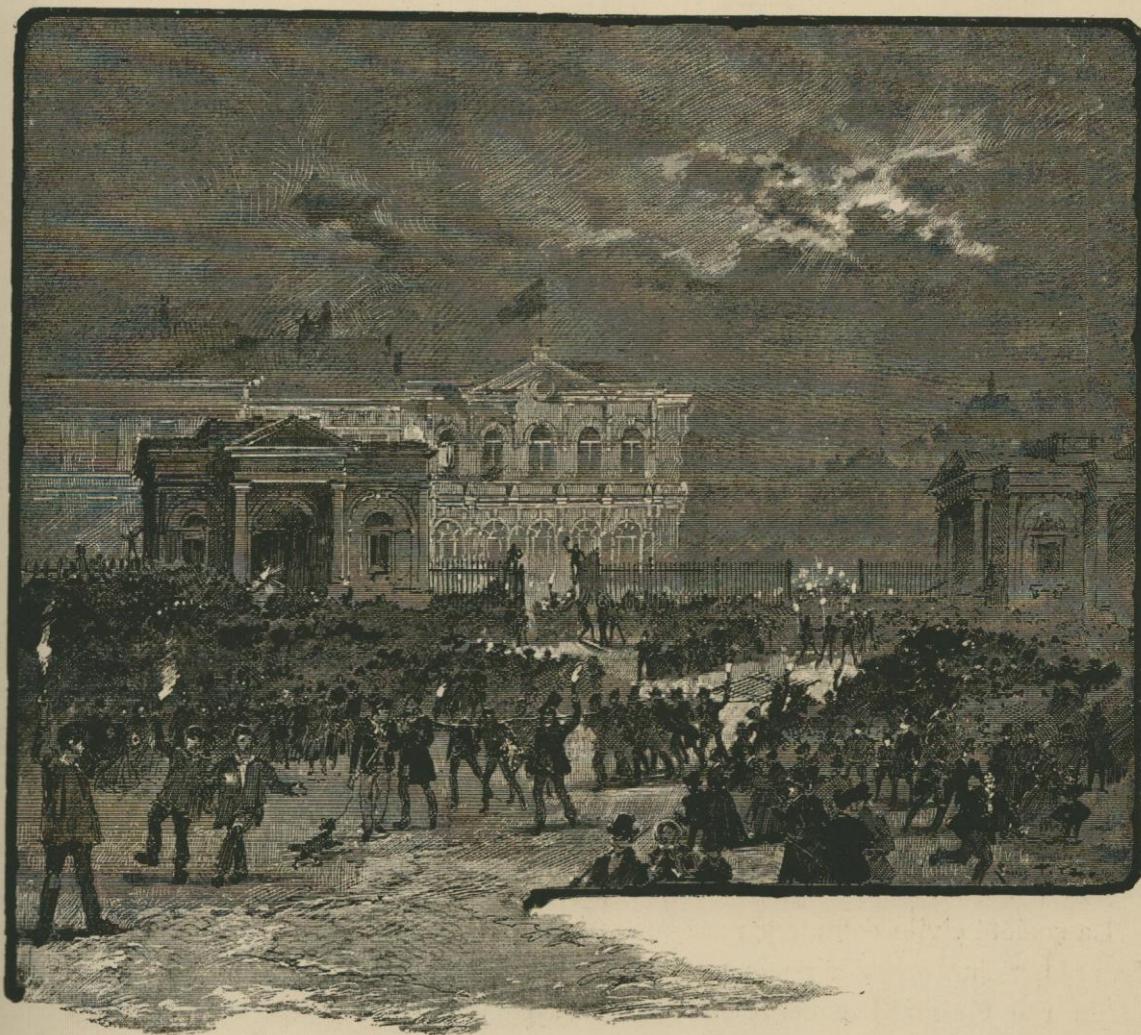
LA PORTE DE NAMUR DANS LA NUIT DU 21 JUILLET 1860. (L'ABOLITION DES OCTROIS.)

Il y eut, dans cette explosion d'enthousiasme un peu tumultueux, des incidents comiques. Ici des employés de l'octroi, au dernier coup de l'heure fatale, décampaient